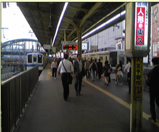
駅舎の改修が望まれる東武野田線大宮駅

今後、皆様が安全で快適な交通環境を整えるために、早期に当議員連盟の目的を達成できるよう努めてまいります。